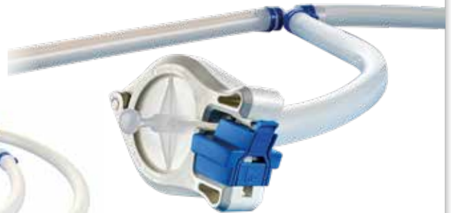
puresu Schlauch-Assembly mit Pumpsil-Schläuchen, BioBarb, Steckverbindern, platinvernetzten Silikondichtungen und Q-Clamp, hygienische Tri-Clamp