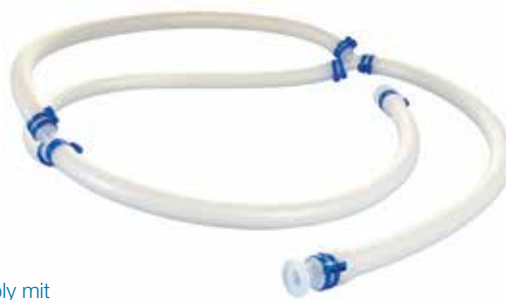
puresu Assembly mit PureWeld XL-Schläuchen, BioBarbs und Bio Y

In Kooperation mit Ihnen legen wir die perfekte, maßgeschneiderte Fluid-Path-Lösung für Ihre Anwendung aus.