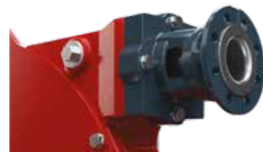
► Robust flensbrakett