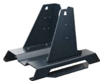
► Kraftig ramme for sikrere transport