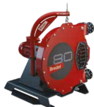
► Løfteenhet for deksel